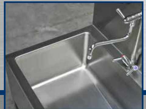
Projecten farmacie en voeding