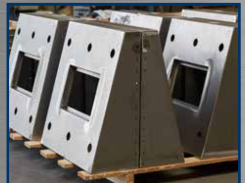
Overige projecten industrie - design - bouw ... in inox, aluminium en staal