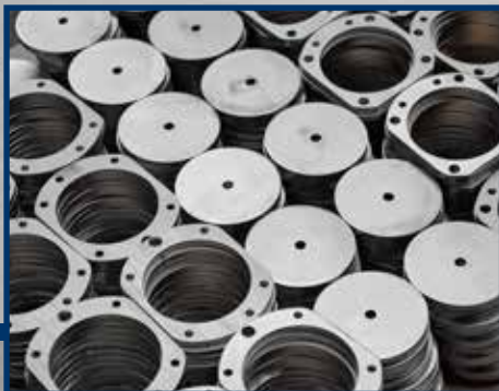
Toelevring snijden, plooiën

UW PARTNER VOOR PLAATWERK EN CONSTRUCTIE